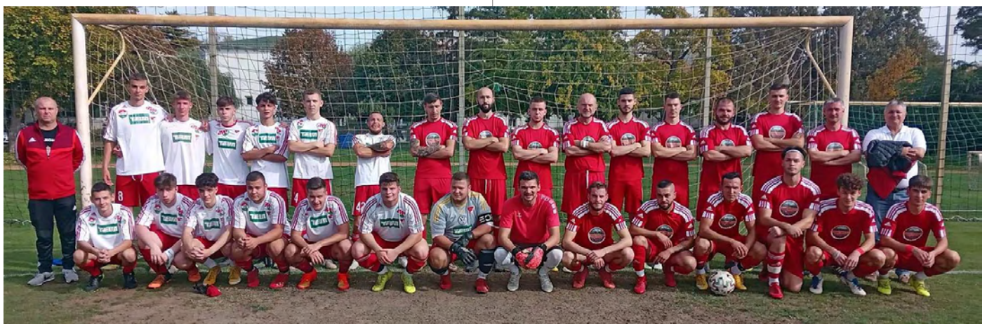
Felnőtt és ifjúsági labdarúgó csapatunk a Debreceni egyetemisták elleni mérkőzés előtt

Írások, képek elküldhetők e-mailben: letahirek@gmail.com Leadhatók: a Városházán: Kossuth u. 4. II. emelet 12. iroda Mobil elérhetőség: +36 30 336 7178