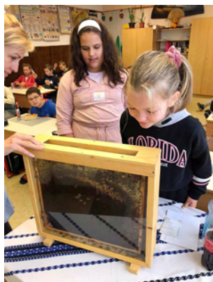
Méhecskék az 5. osztályban

Az izgalmas pillanatok feledhetetlen élményt nyújtottak a gyerekeknek.