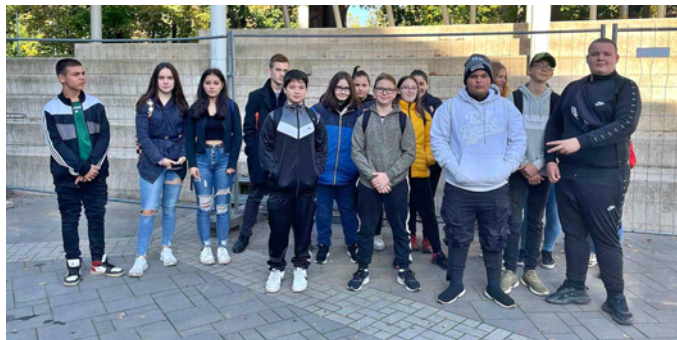
Pályaválasztási rendezvényen végzőseink

A 8. osztályos tanulók számára szervezett kötelező pályaválasztást megalapozó kompetenciák vizsgálatának mérésére szeptember végén került sor iskolánkban. A mérés során a diákok visszajelzést kaptak a hozzájuk leginkább illeszkedő középfokú továbbtanulási irányokról.