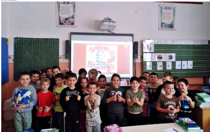
Mesetúrára az első osztály

Szeptember 30-án a Magyar Népmese Napja alkalmából könyvtári foglalkozás keretében az 1. és 2. osztályos tanulók mesetúrára vettek részt.